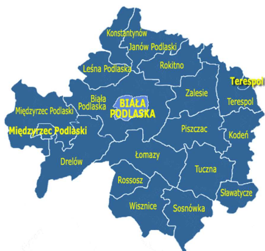
Rysunek 1. Mapa Powiatu Bialskiego

Jedną z form skupiających osoby zaangażowane w pomoc rodzinom dotkniętym przemocą domową są Zespoły Interdyscyplinarne funkcjonujące we wszystkich gminach Powiatu Bialskiego.